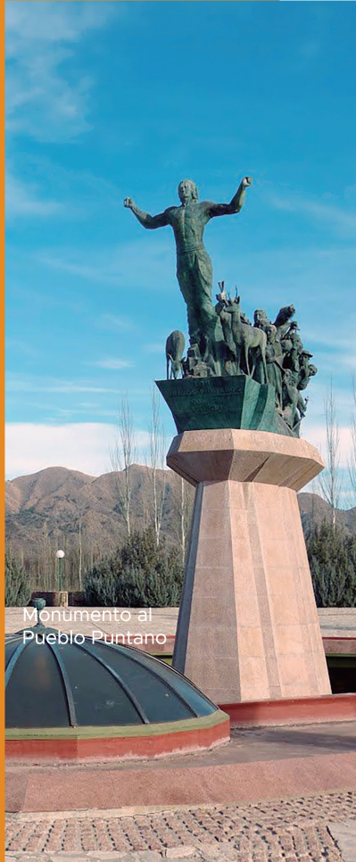
Monumento al Pueblo Puntano